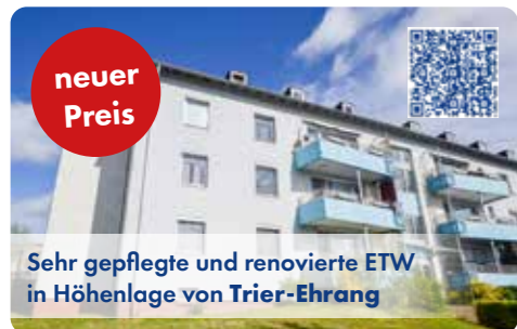
Sehr gepflegte und renovierte ETW in Höhenlage von Trier-Ehrang

/// Sie möchten Ihre Immobilie verkaufen? Jetzt Termin zur kostenlosen Erstberatung sichern. ///