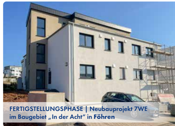
FERTIGSTELLUNGSPHASE | Neubauprojekt 7WE im Baugebiet „In der Acht“ in Föhren

/// Für die Realisierung von hochwertigen Wohnanlagen und Projekten suchen wir stetig Grundstücke und Bestandsimmobilien. ///