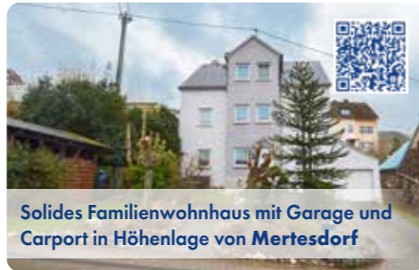
Solides Familienwohnhaus mit Garage und Carport in Höhenlage von Mertesdorf

Geräumiges Familienhaus, ca. 203 m 2 Wfl., ca. 500 m 2 Grdstfl., 6 Zimmer, Terrasse, Pavillon, Vor-/Ziergarten, Garage, Carport, Gerätehaus EVA/C/97,20kWh/Öl/ZH/Bj 2000