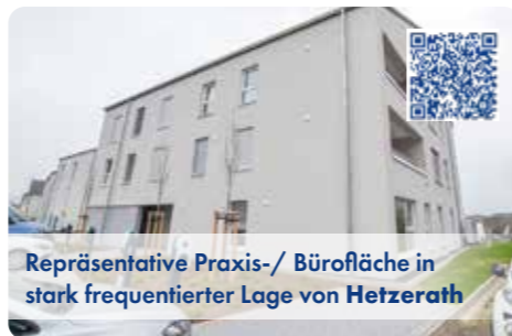
Repräsentative Praxis-/ Bürofläche in stark frequentierter Lage von Hetzerath

Praxis-/Gewerbeimmobilie mit umfangreichem Nutzungskonzept, ca. 211 m 2 Gesamtfl., Teilung der Fläche (jeweils ca. 100 m 2 ) möglich. Energieausweis in Erstellung/Vorlage bei Besichtigung.