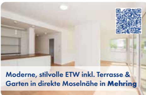
Moderne, stilvolle ETW inkl. Terrasse & Garten in direkte Moselnähe in Mehring

Diese sehr gepflegte und neuwertige ETW bietet Wohnraum mit ca. 97 m 2 Wfl. und 3 Zimmern viel Lebensqualität in der beliebten Moselregion. EBA/B/59,40kWh/Pellet/ZH/Bj 2018