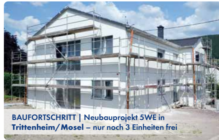
BAUFORTSCHRITT | Neubauprojekt 5WE in Tritenheim/Mosel – nur noch 3 Einheiten frei

Bei unserem Neubauprojekt mit 5 ETW an der Mosel laufen die Bauarbeiten weiterhin im Zeitplan. Aktuell werden die Rohinstallationen für Elektro und Sanitär sowie die Innenputzarbeiten ausgeführt. Im Außenbereich wurde das Gelände verfüllt und mit besserem Wetter beginnen demnächst die Außenputzarbeiten. Eine weitere Einheit ist reserviert und wir stehen in konkreten Gesprächen mit einigen Interessenten. Sie wollen bis Herbst in direkter Nähe zur charakteristischen Mosellandschaft wohnen? Kontaktieren Sie uns und bemustern Sie Ihre Traumwohnung nach individuellen Vorstellungen in ansprechender Ausstattung.