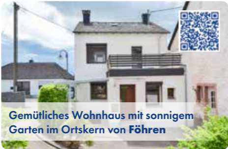
Gemütliches Wohnhaus mit sonnigem Garten im Ortskern von Föhren

Gepflegtes, sehr solides EFH in ruhigem Anliegerbereich, 4 Zimmer, ca. 90 m 2 Wfl., ca. 190 m 2 Grdstfl., überdachte Terrasse, kleiner u. geschützter Garten EBA/B/54,69kWh/Öl/Bj 1961