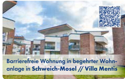
Barrierefreie Wohnung in begehrter Wohnanlage in Schweich-Mosel // Villa Mentis

Attraktive im EG liegende ETW mit 2 Zimmern, ca. 63 m 2 Wfl. und Terrasse in begehrter, altengerechter Wohnanlage „Villa Mentis“ in Schweich. EBA/B/68,5kWh/Pellet/Bj 2014