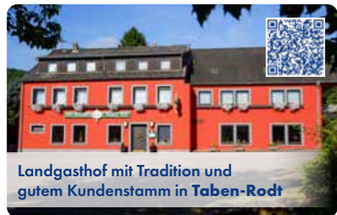
Landgasthof mit Tradition und gutem Kundenstamm in Taben-Rodt

Hotel-Restaurant „Rodter Eck“ mit Familientradition seit Mitte des 19. Jh., ca. 856 m 2 Gesamtfl., ca. 2.030 m 2 Grstfl., gr. sonnige Gartenterrasse u.v.m. EBA/E/137,6kWh/Öl/ZH/Bj 1900