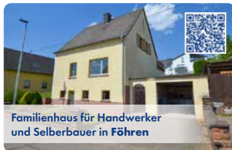
Familienhaus für Handwerker und Selberbauer in Föhren

Kompaktes Familienhaus in bevorzugter, ruhiger Wohnlage von Föhren mit ca. 800 m 2 großem sonnigen Grundstück. 5 Zimmer ca. 145 m 2 Wfl. EBA/D/124kWh/Öl/ZH/Bj 1959