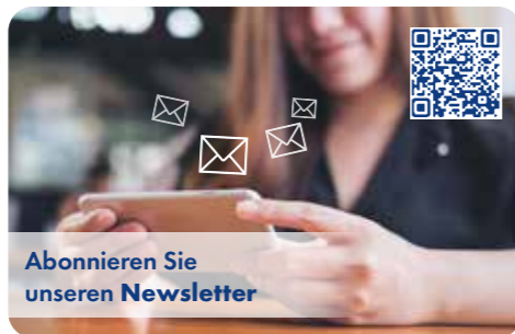
Abonnieren Sie unseren Newsletter

Demnächst für Sie in unserer Vermarktung: Unter anderem EFH in Föhren, Tritenheim, Ziemer-Rodt, MFH in Trier-Quint, etc. Lassen Sie sich telefonisch vormerken oder tragen Sie sich zu unserem Newsletter ein.